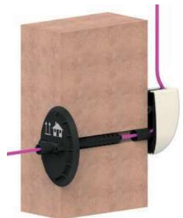
▲ Gerade eingebaut mit Abdeckung