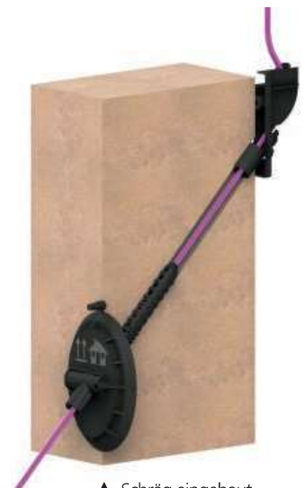
▲ Schräg eingebaut