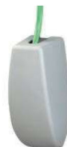
▲ Abdeckung für Innenteil